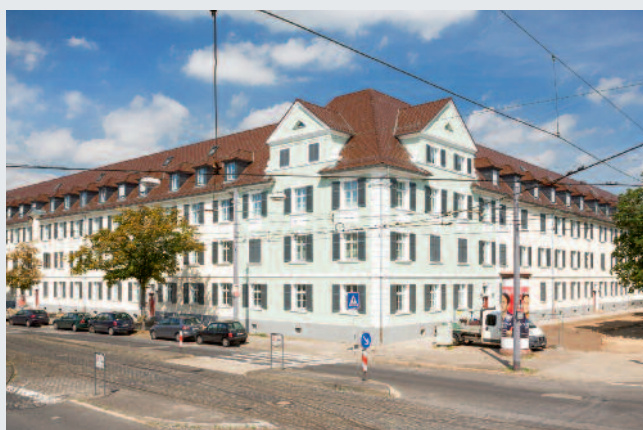
Außenfassade und ...

In Einzelfällen baut die BASF-Tochter auch neu. In den kommenden fünf Jahren entstehen rund 200 neue Wohnungen.