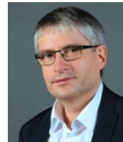
Staatssekretär Sven Giegold BMWK (angefragt)