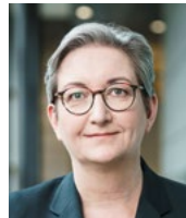
Bundesbauministerin Klara Geywitz (SPD)