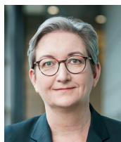
Bundesbauministerin Klara Geywitz (SPD)