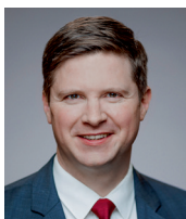
Parl. Staatssekretär Dr. Florian Toncar, MdB (FDP), BMF